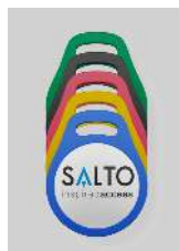
Llaveros Fob NXP MIFARE®