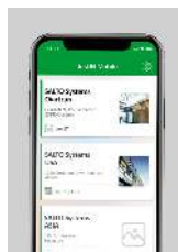
Llave digital Bluetooth LE NFC - Near Field Communication