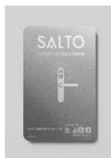
Tarjetas NXP MIFARE®