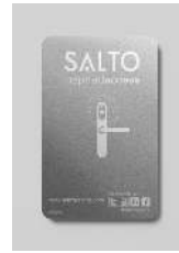
Tarjetas NXP MIFARE® HID®