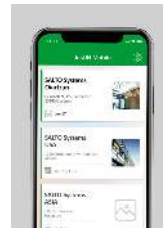
Llave digital Bluetooth LE NFC - Near Field Communication