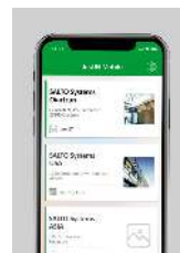
Llave digital Bluetooth LE NFC - Near Field Communication