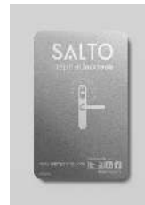
Tarjetas NXP MIFARE® HID®