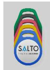
Llaveros Fob NXP MIFARE®