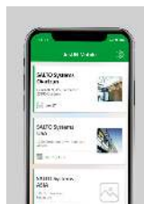
Llave digital Bluetooth LE NFC - Near Field Communication