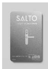
Tarjetas NXP MIFARE® HID®