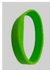
Pulseras de silicona NXP MIFARE®