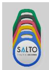
Llaveros Fob NXP MIFARE®